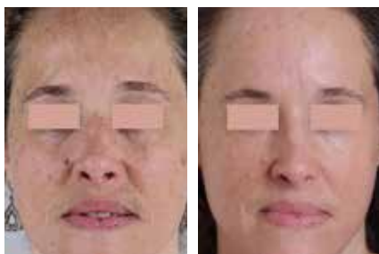
Abb. 3a+b: Ölige, unempfindliche Haut mit Pigmentstörungen. Vor und nach 4 Monaten Behandlung.