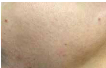
Abb. 1a+b: Aknebehandlung. Ergebnis vor und nach 6 Wochen.